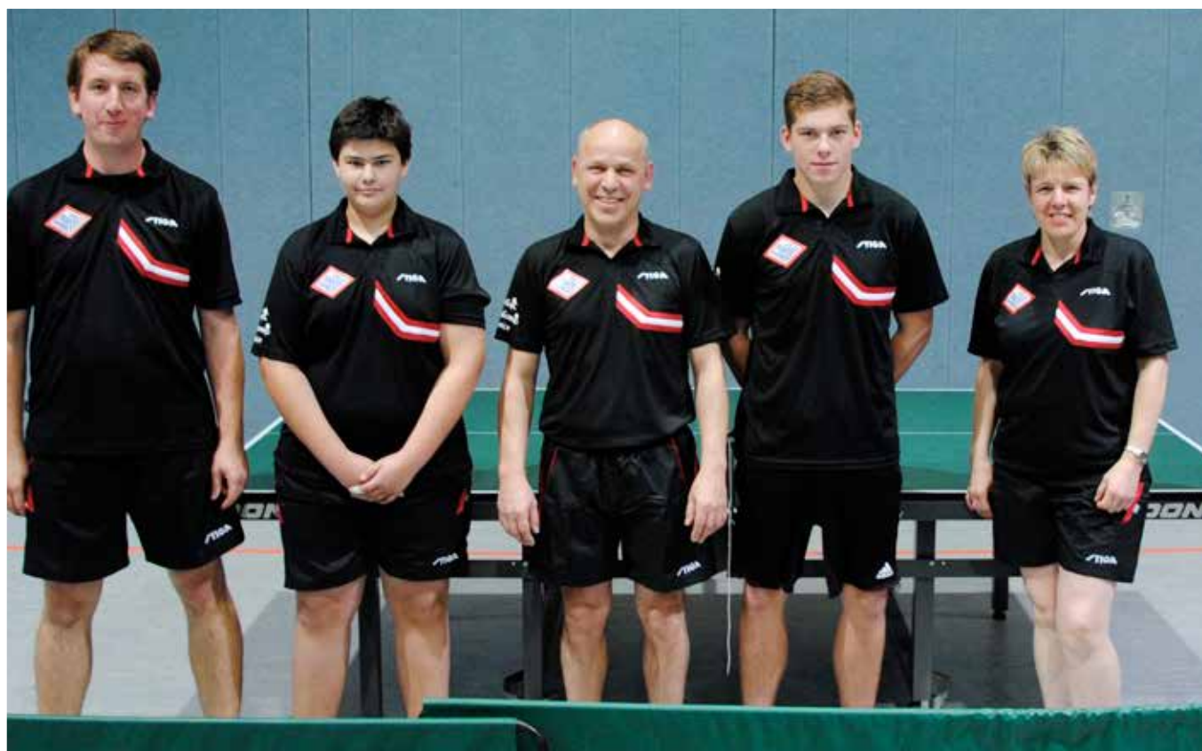
Unsere 2. Herrenmannschaft