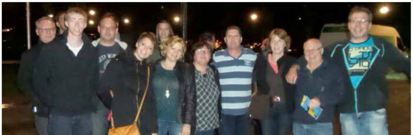
Besuch des Länderspiels Deutschland-Belgien