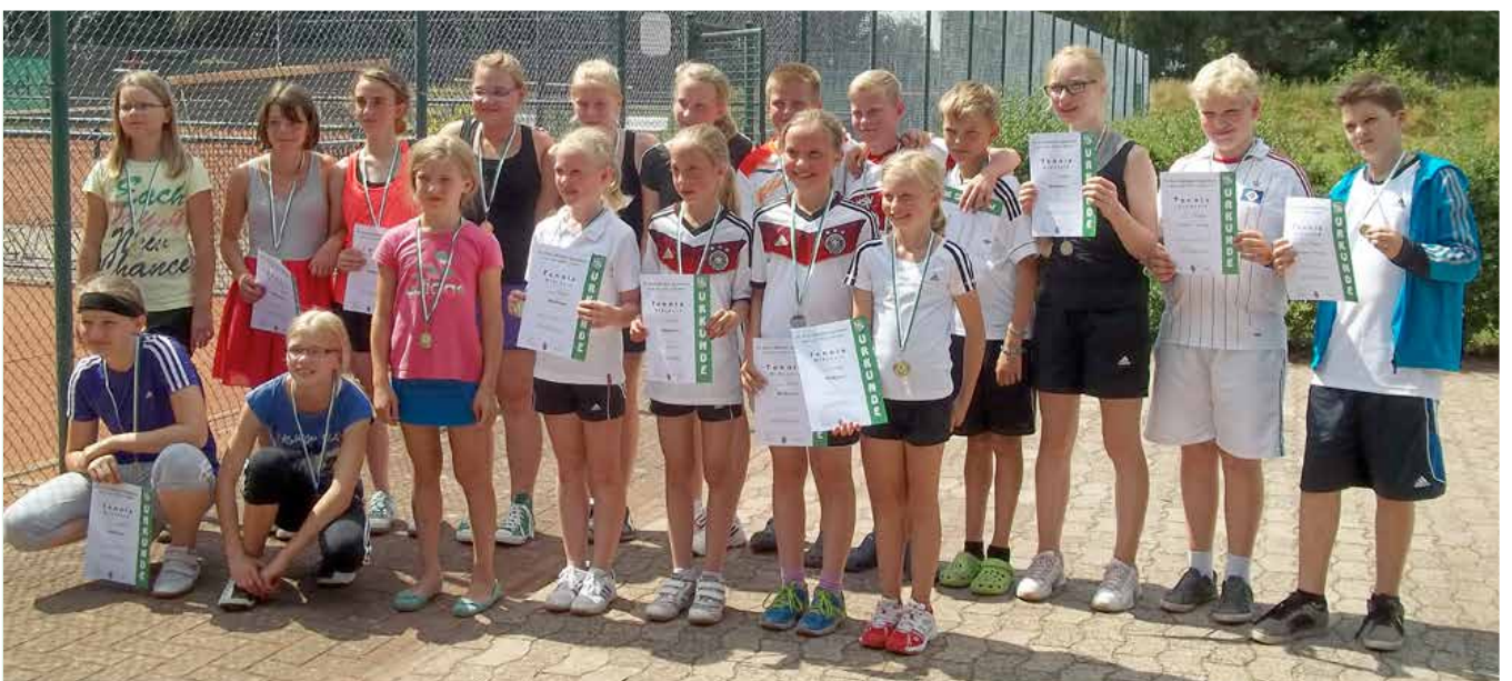
Siegmann Cup 2014