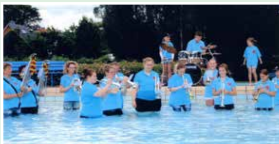
Cold Water Challenge

Highlights in 2014 waren unsere Auftritte beim Osterfeuer in Bothel, unsere Cold Water Challenge im Botheler Freibad, das Schützenfest in Lehrte (die Freundschaft mit der Brassband Lehrte wurde wieder aufgenommen) und das Oktoberfest in Waffensen (1 Stunde Konzert vor 1000 Zuschauern).