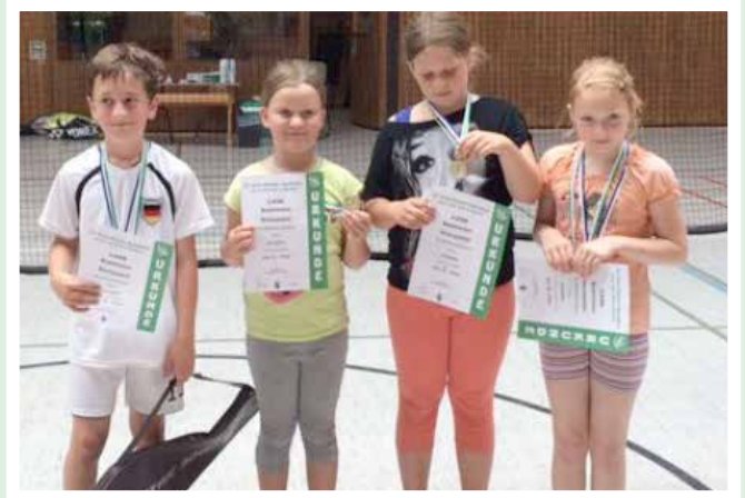
Erfolge für die Jüngsten

Trainingszeit Erwachsene: Montag 19.00-20.30 Uhr, gr. Turnhalle