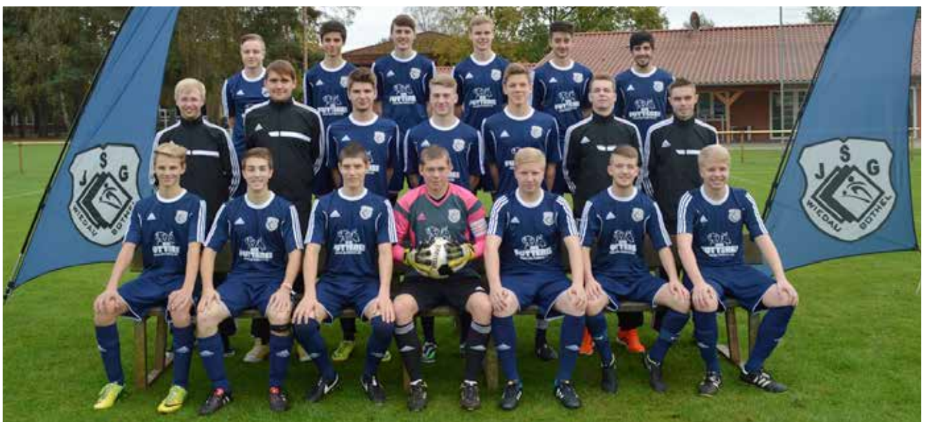
Unsere U19 in den neuen Farben der JSG Wiedau/Bothel