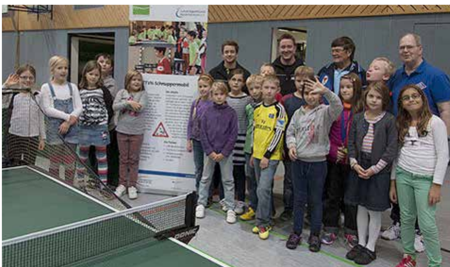
Besuch des „Schnuppermobils“

Seit dieser Saison gehen wir sogar wieder mit einer 4. Herrenmannschaft auf Punktejagd. Diese spielt aktuell in der noch recht jungen Freizeitliga Rotenburg.