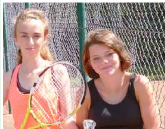
Sieger beim Siegmann Cup 2014