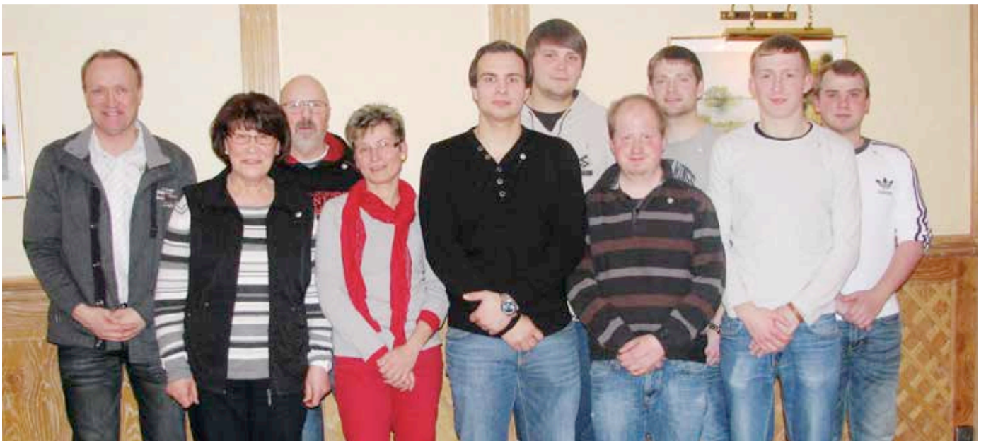
Silberne und Goldene Ehrennadel für 20 und 35 Jahre Mitgliedschaft